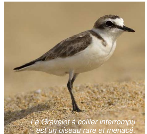
Le Gravelot à collier interrompu est un oiseau rare et menacé.

Parce que la plupart des visiteurs ignorent que la nidification du gravelot à collier interrompu (espèce protégée) s'effectue sur les hauts de plage et dans les dunes d'avril à septembre, le Syndicat Mixte Dunes Sauvages de Gâvres à Quiberon emploie, de mai à juillet, deux personnes afin de mener l'opération « on marche sur des œufs ». Cette action doit permettre de sensibiliser, à l'entrée des plages, les usagers à la préservation de l'espèce. En parallèle, et comme chaque année, des petits enclos en bois seront installés autour des nids pour les identifier et éviter les dérangements pendant la période de couvainon.